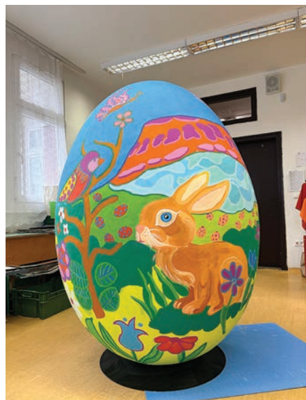
A SZÍN-VONAL Alapfokú Művészeti Iskola tanulói a város számára gyönyörű óriástojást festettek